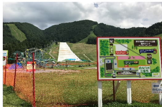
野沢温泉スポーツ公園